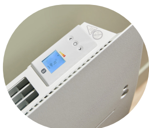
1 - Boîtier de commande digital 2 - Corps de chauffe en aluminium 3 - Façade acier